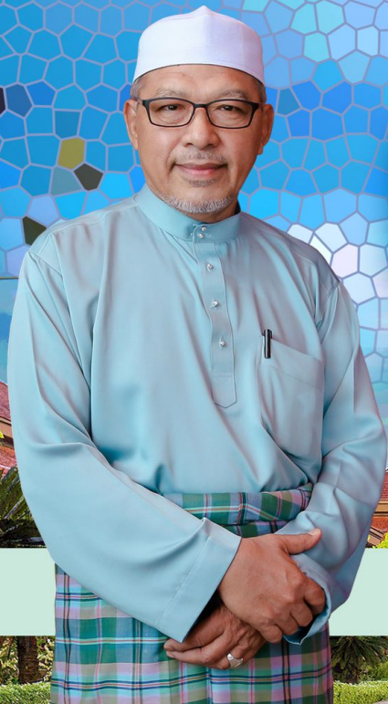
YAB USTAZ DATO' HAJI AHMAD BIN YAKOB (DATO' BENTARA KANAN)